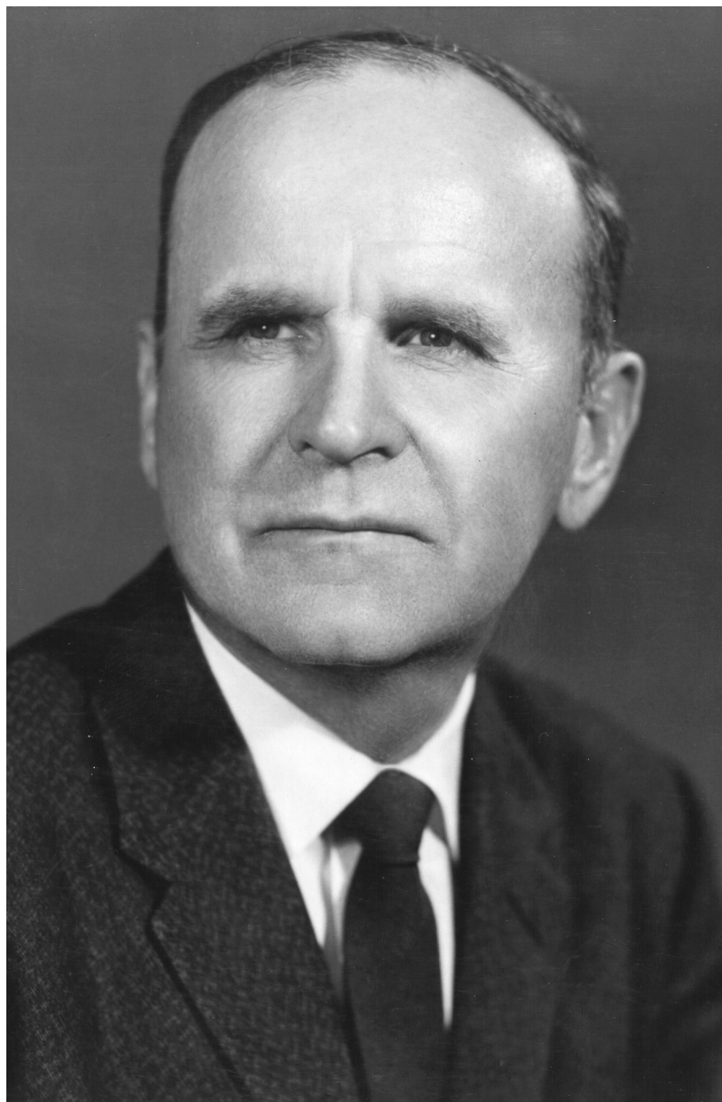
УИЛЛЪЯМ МАРРИОН БРАНХАМ